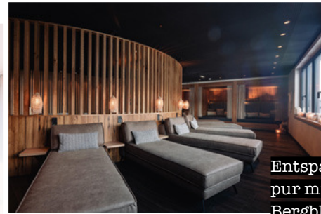
Entspannung pur mit Bergblick