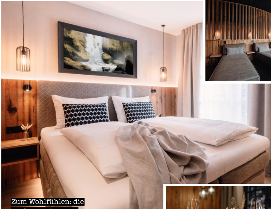
Zum Wohlfühlen: die modernen Zimmer im Boho-Stil